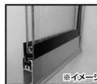
※イメージ ペアガラス(断面)