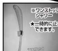
※ワンストップ シャワー ★一時的に止水 できます。 節水型水栓