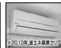
※2010年省エネ基準クリア エアコン