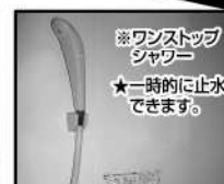
※ワンストップシャワー ★一時的に止水できます。