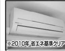
※2010年省エネ基準クリア エアコン