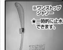
※ワンストップ シャワー ★一時的に止水 できます。