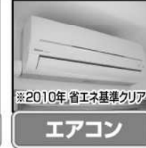
※2010年省エネ基準クリア エアコン