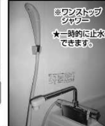
※ワンストップ シャワー ★一時的に止水 できます。