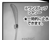
※ワンストップ シャワー ★一時的に止水 できます。