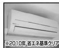
※2010年省エネ基準クリア エアコン