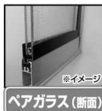
※イメージ ペアガラス(断面)