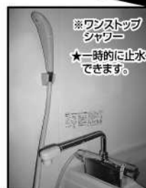
※ワンストップ シャワー ★一時的に止水 できます。

ユーマンションが 初めて 田野町に誕生! 鉄筋コンクリート造により 遮音性能 大!!