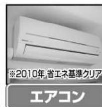
※2010年省エネ基準クリア エアコン